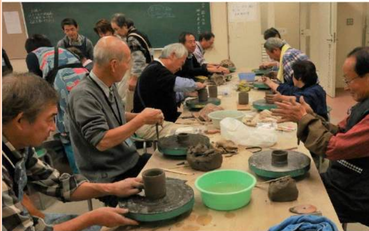
和気あいあいと作陶中