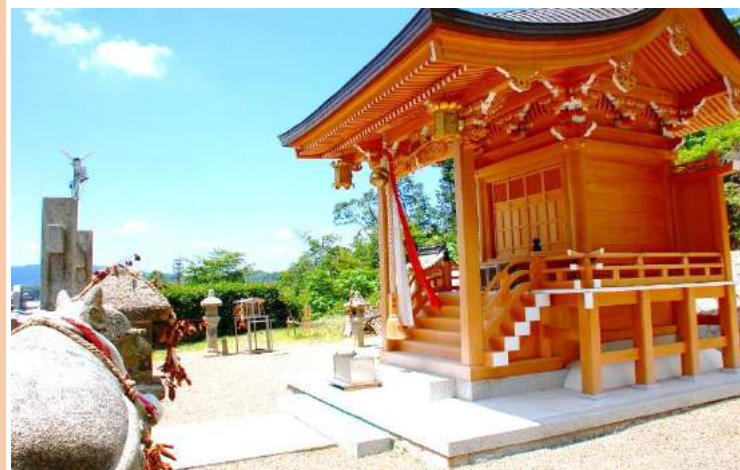
完成した「枝天満宮」