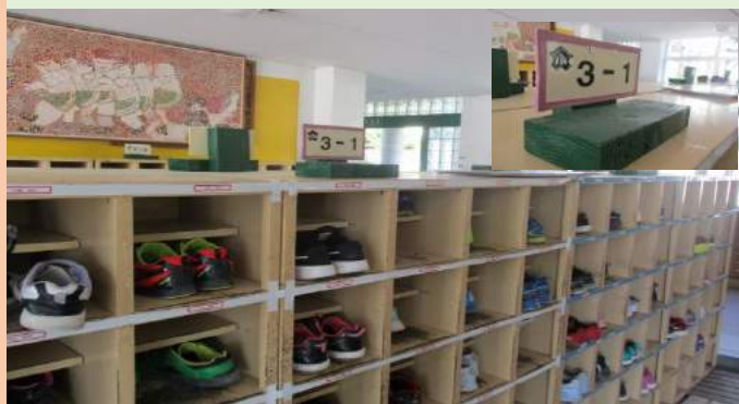
靴箱の上に置かれて子どもたちも見やすくなりました

今年度の新学期から靴箱の上に設置され、昇降口の雰囲気も明るくなり、学年ごとに縁取り色も変えていることで、子どもたちも見やすくなりました。