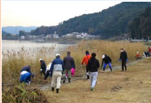
ヨシ刈り(蜷谷にて)