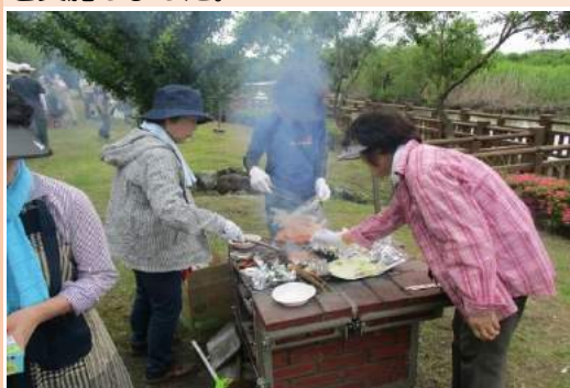
作業後のバーベキュー

竹林の伐採は直径3cm以下の細い竹を間引き、伐採した竹を運び出し、枝を払う一連の作業でしたが、集積する場所までの運び出しが特に重労働で大変な作業でした。当日は今にも雨が降りそうな梅雨空の中、作業を効率よく行いました。公園担当者からは、来年以降も是非とも継続してほしいと要望があり、感謝されました。